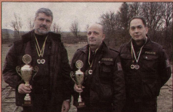
Vítězné družstvo znojemských střelců.

Viz také Na střelecké loučení... na str. 14