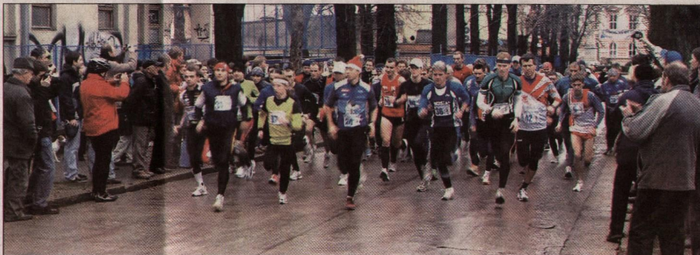
Na start letošního Vánočního běhu se postavilo rovných osmdesát běžců.