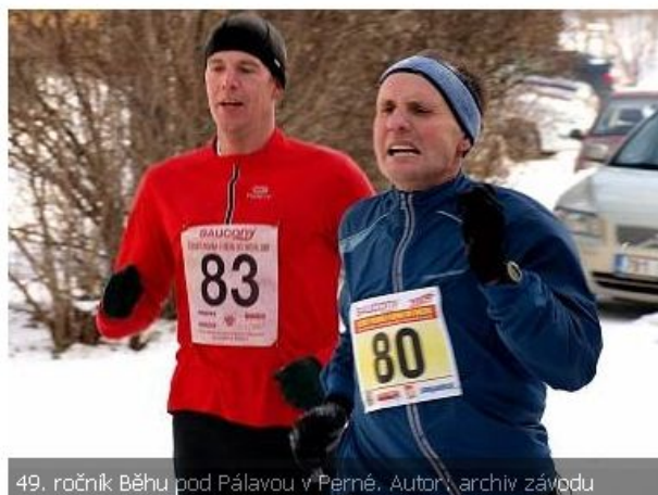
49. ročník Běhu pod Pálavou v Perné.